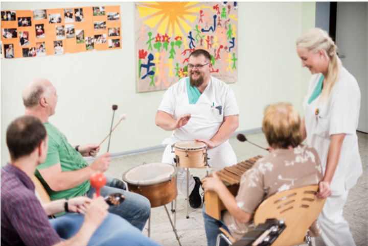
Die bezirklichen Gesundheitseinrichtungen bieten eine stationäre, teilstationäre und ambulante Versorgung an. Unser Foto zeigt eine musiktherapeutische Sitzung.