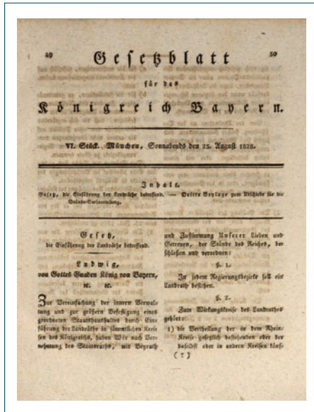
Gesetz, die Einführung der Landräthe betreffend vom 23. August 1828, siehe: Gesetzblatt für das Königreich Bayern (1828) - Bayerische Staatsbibliothek (bsb-muenchen.de)

König Ludwig I. erließ im August 1828 das „Gesetz, die Einführung der Landräthe betreffend“ 13 . Darin waren die Vorläufer der heutigen Bezirke, damals waren es acht Kreise, erwähnt. In diesen sollten Landräthe gebildet werden, deren jeweils 24 Mitglieder vorwiegend Kompetenzen in Haushaltsfragen hatten und denen nur bedingt die Vertretung der Interessen der Region ermöglicht wurde. Die Aufgabe der damaligen „Landräthe“ unterscheidet sich damit grundsätzlich von der der „Landräte“ der Gegenwart.