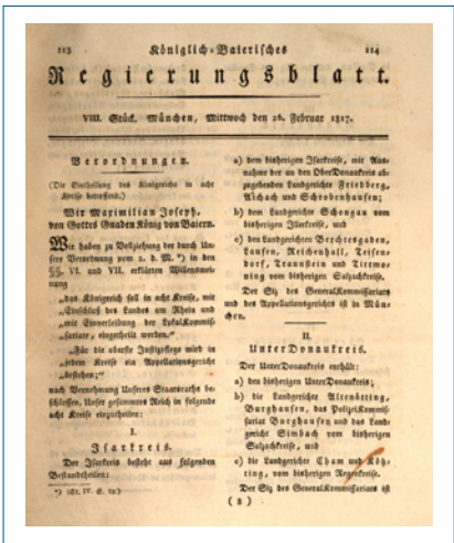
Verordnung: Die Eintheilung des Königreichs in acht Bezirke betreffend vom 26. Februar 1817, in: Königlich-Bayerisches Regierungsblatt vom 26. Februar 1817. Bayerische Staatsbibliothek (bsb-muenchen.de) .

Die in der Verfassung vom 1. Mai 1808 vorgesehenen „allgemeinen Versammlungen“ und Deputationen 11 wurden nie umgesetzt. Benannt waren die Kreise nach Flüssen. Diese Art Bezirksgliederung hat Bayerns König Max I. Joseph 1817 im Rahmen einer umfassenden und über mehrere Jahre vollzogenen Verwaltungs-, Finanz- und Justizreform weiter fortgeschrieben. Zu diesem Zeitpunkt gab es in seinem Königreich acht Kreise: Isarkreis, Oberdonaukreis, Unterdonaukreis, Regenkreis, Obermainkreis, Untermainkreis, Rezatkreis und Rheinkreis (die damals bayerische Pfalz gehört heute zu Rheinland-Pfalz) 12 . In jedem Kreis wurde ein Lokalkommissariat und ein Appellationsgericht errichtet – als Mindestausstattung an Verwaltungsstrukturen und Gerichtsbarkeit.