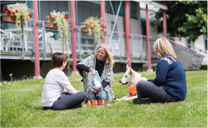
In den Kliniken der Bezirke werden Kinder und Jugendliche sowie Erwachsene mit psychischen Erkrankungen behandelt. Unser Foto zeigt die Arbeit mit einem Therapiehund.