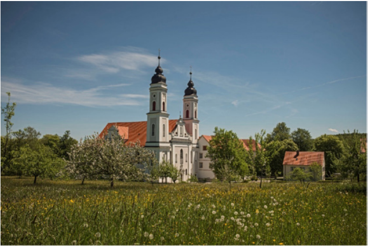
Die ehemalige Benediktinerabtei Irsee dient heute dem Bayerischen Bezirkstag sowie dem Bezirk Schwaben als Bildungs-, Tagungs- und Kulturzentrum.