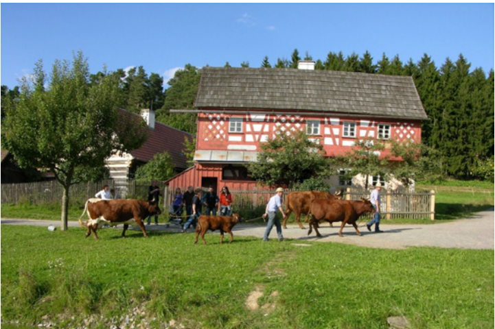
Die Bezirke unterhalten Freilichtmuseen in ganz Bayern. Darin informieren sie über frühere Bau- und Lebensweisen. Unser Bild zeigt das Freilandmuseum Oberpfalz in Neusath-Perschen.